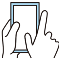
コンプライアンス研修